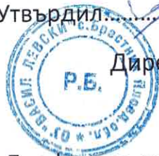
График за провеждане на дейности ОПРЛ през месец Юни 2021г.